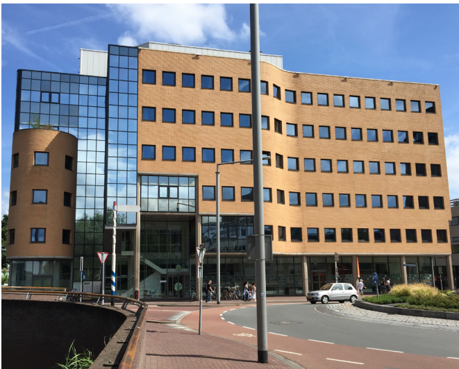
DOK 40, Dordrecht, Hollande