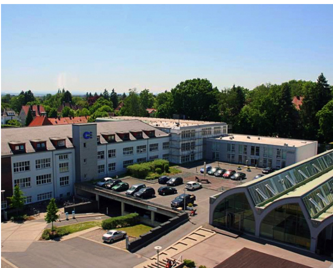
Campus 3, Braunschweig, Allemagne