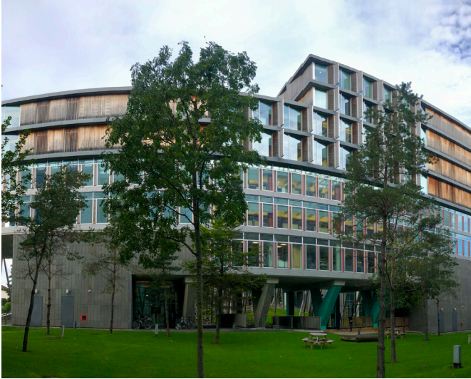
Elm Park, Dublin, Irlande