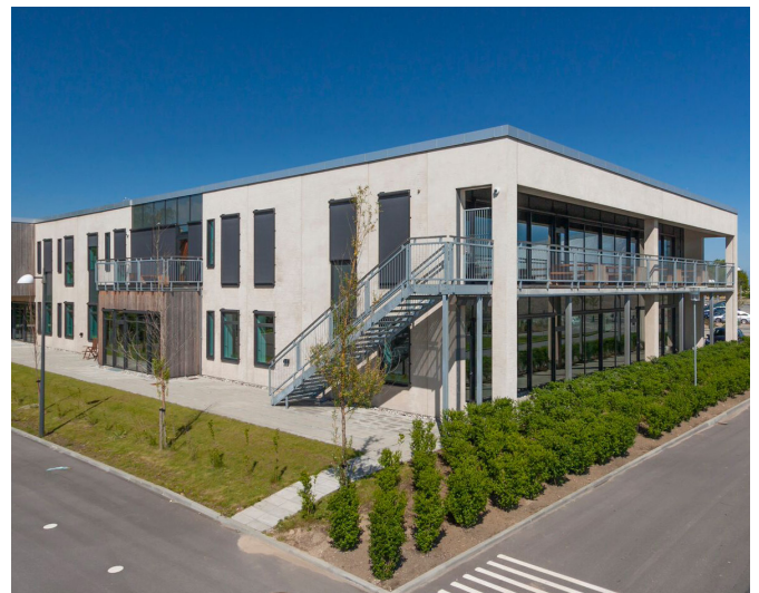
Kajakvej 2, Kastrup, Danemark