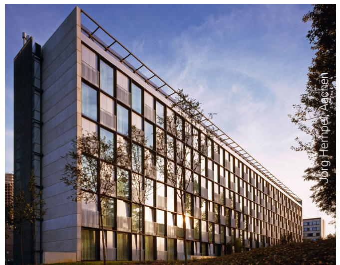
INNSIDE Hotel, Düsseldorf, Allemagne